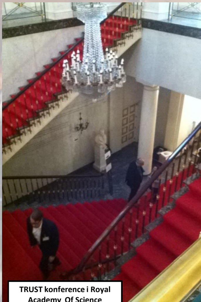
TRUST konference i Royal Academy Of Science

Gode venskaber, belgiske øl og EU-politik tæt på.