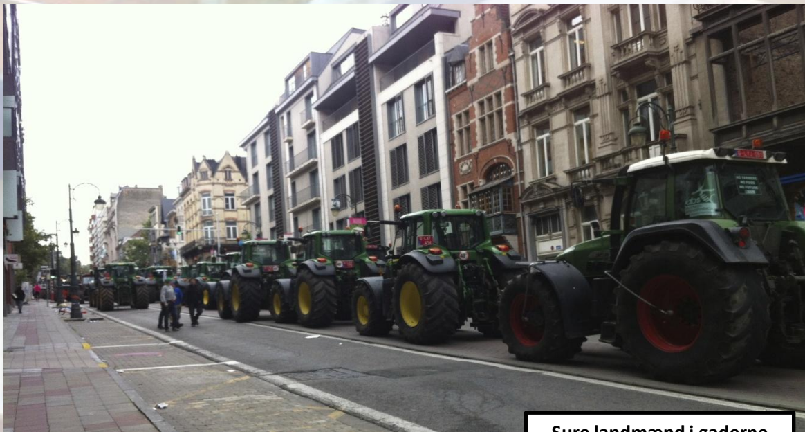
Sure landmænd i gaderne