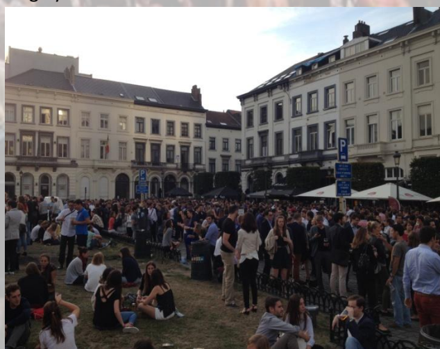
Torsdagsstemning på Place Lux

Jeg kan ikke rigtig nævne én enkeltstående begivenhed som min største oplevelse i løbet af min tid som praktikant på Region Syddanmarks EU-kontor, for der har simpelthen været for mange gode oplevelser. Det har været en stor oplevelse at være her i Bruxelles, få lov til at bo og arbejde et halvt år i udlandet, komme ind under huden på en ny kultur, rejst og set forskellige sider af Belgien, som f.eks. Antwerpen og Gent, og fået en masse ny viden, nyt netværk og nye venner.