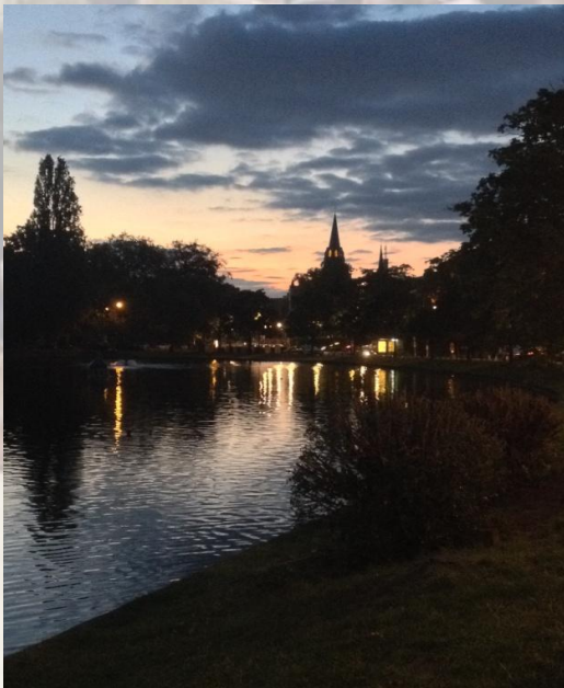
Aftentide i Ixelles